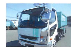
粗大ごみ、廃機械等重量物対応可能です。