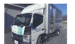
感染性廃棄物やパレット品及びドラム缶入廃液等重量物回収対応可能です。