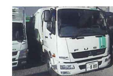
廃プラスチック類、ゴムくず、紙くず、木くず、繊維くず等、バラ状廃棄物対応致します。