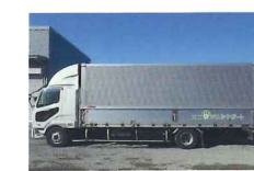
感染性廃棄物対応可のアルミバン車になります。