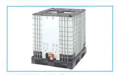
液体輸送用1立米プラスチックコンテナ