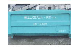
8立米フックロールコンテナ