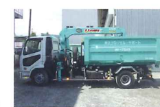
粗大ごみ、廃機械等重量物対応可能です。