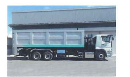
最大積載量11400kgの大型フック車両です。長距離・大量運搬も可能です。