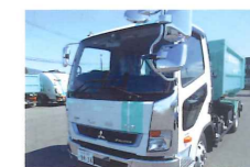
租大ごみ、廃機械等重量物対応可能です。