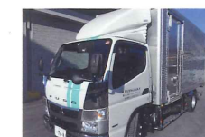
感染性廃棄物やパレット品及びドラム缶入廃液等重量物回収対応可能です。