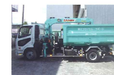
租大ごみ、廃機械等重量物対応可能です。