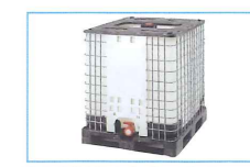
液体輸送用1立米プラスチックコンテナ