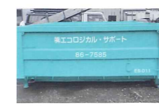
8立米フックロールコンテナ