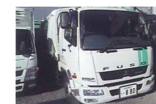
廃プラスチック類、ゴムくず、紙くず、木くず、繊維くず等、バラ状廃棄物対応致します。

当社保有の車両及び収集容器の数々をご紹介します。株式会社エコロジカル・サポートは、お客様の多種多様なニーズにお答えすべく、車両や収集容器をご準備いたします。