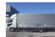
感染性廃棄物対応可のアルミバン車になります。