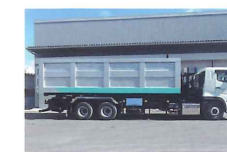
最大積載量11400kgの大型トラック車両です。長距離・大量運搬も可能です。